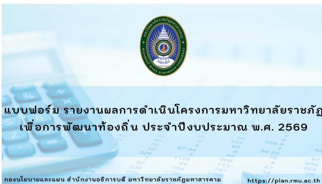
ภาพที่ 5 แบบฟอร์ม รายงานผลการดำเนินโครงการมหาวิทยาลัยราชภัฏเพื่อการพัฒนาท้องถิ่น ประจำปีงบประมาณ พ.ศ. 2569

กลุ่มงานวิเคราะห์นโยบายและแผน กองนโยบายและแผน สำนักงานอธิการบดี มหาวิทยาลัยราชภัฏมหาสารคาม ได้เผยแพร่ข้อมูล แบบฟอร์ม รายงานผลการดำเนินโครงการมหาวิทยาลัยราชภัฏเพื่อการพัฒนาท้องถิ่น ประจำปีงบประมาณ พ.ศ. 2569 https://plan.rmu.ac.th/th/?p=6440