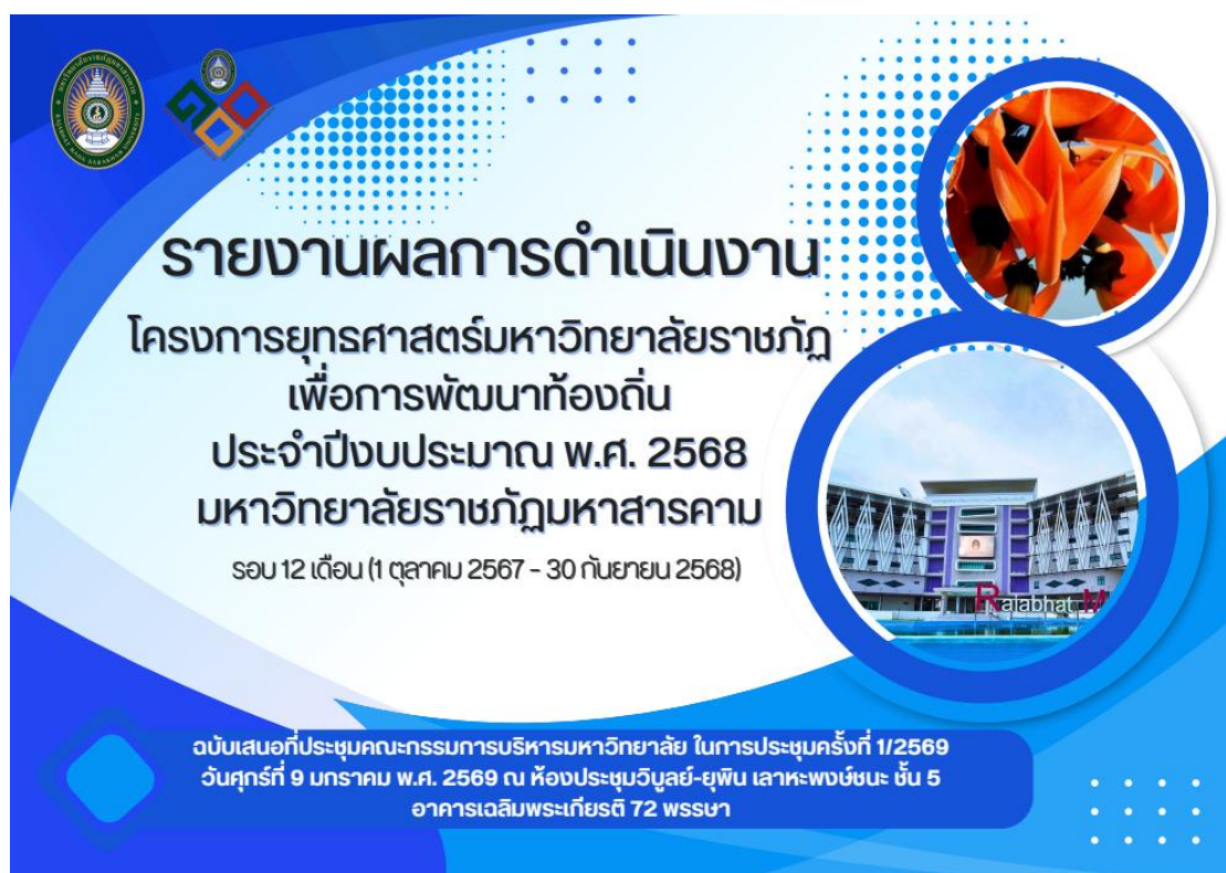
ภาพที่ 2 รายงานผลการดำเนินงานตามโครงการยุทธศาสตร์ เพื่อการพัฒนาท้องถิ่น ประจำปีงบประมาณ พ.ศ. 2568 มหาวิทยาลัยราชภัฏมหาสารคาม รอบ 12 เดือน (1 ตุลาคม 2567 -30 กันยายน 2568)

กลุ่มงานวิเคราะห์นโยบายและแผน กองนโยบายและแผน สำนักงานอธิการบดี มหาวิทยาลัยราชภัฏมหาสารคาม ได้เผยแพร่ข้อมูล รายงานผลการดำเนินงานตามโครงการยุทธศาสตร์ เพื่อการพัฒนาท้องถิ่น ประจำปีงบประมาณ พ.ศ. 2568 มหาวิทยาลัยราชภัฏมหาสารคาม รอบ 12 เดือน (1 ตุลาคม 2567 -30 กันยายน 2568) https://plan.rmu.ac.th/th/?p=6374