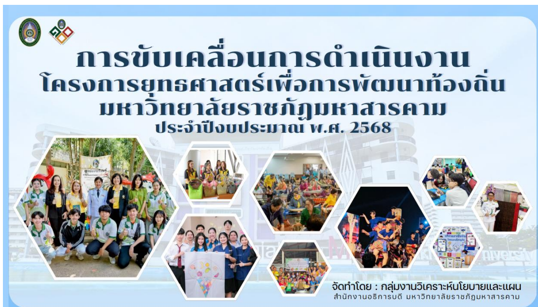
ภาพที่ 3 การขับเคลื่อนการดำเนินงานตามโครงการยุทธศาสตร์ เพื่อการพัฒนาท้องถิ่น มหาวิทยาลัยราชภัฏมหาสารคาม ประจำปีงบประมาณ พ.ศ. 2568

กลุ่มงานวิเคราะห์นโยบายและแผน กองนโยบายและแผน สำนักงานอธิการบดี มหาวิทยาลัยราชภัฏมหาสารคาม ได้เผยแพร่ข้อมูล การขับเคลื่อนการดำเนินงานตามโครงการยุทธศาสตร์ เพื่อการพัฒนาท้องถิ่น มหาวิทยาลัยราชภัฏมหาสารคาม ประจำปีงบประมาณ พ.ศ. 2568 https://plan.rmu.ac.th/th/?p=6377