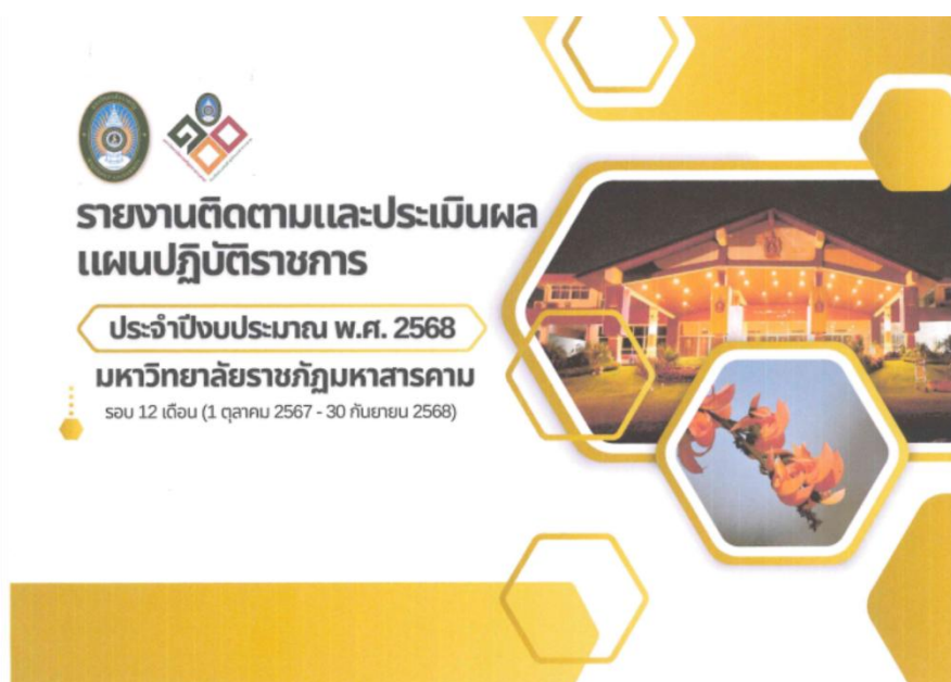
ภาพที่ 1 กิจกรรม รายงานการติดตามและประเมินผล แผนปฏิบัติการ ประจำปีงบประมาณ พ.ศ. 2568 มหาวิทยาลัยราชภัฏมหาสารคาม รอบ 12 เดือน (1 ตุลาคม 2567 – 30 กันยายน 2568)

กลุ่มงานวิเคราะห์นโยบายและแผน กองนโยบายและแผน สำนักงานอธิการบดี มหาวิทยาลัยราชภัฏมหาสารคาม ได้เผยแพร่ข้อมูล รายงานการติดตามและประเมินผล แผนปฏิบัติการ ประจำปีงบประมาณ พ.ศ.2568 มหาวิทยาลัยราชภัฏมหาสารคาม รอบ 12 เดือน (1 ตุลาคม 2567 – 30 กันยายน 2568) https://plan.rmu.ac.th/th/?p=6380