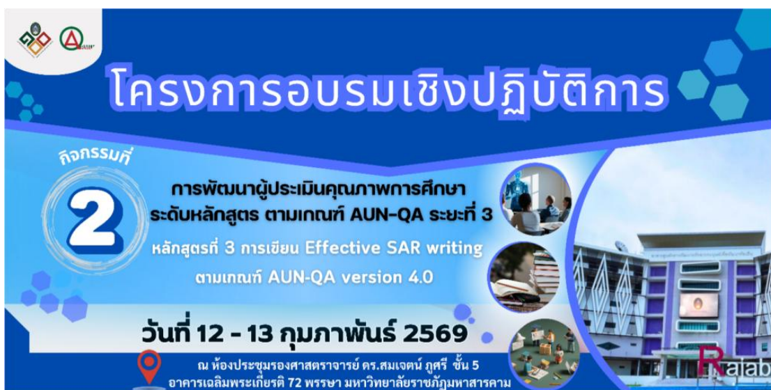
ภาพที่ 7 โครงการอบรมเชิงปฏิบัติการ “การพัฒนาผู้ประเมินคุณภาพการศึกษาระดับหลักสูตรตาม เกณฑ์ AUN-QA ระยะที่ 3 ” หลักสูตรที่ 3 การเขียน Effective SAR writing ตามเกณฑ์ AUN-QA version 4.0

กลุ่มงานประกันคุณภาพ กองนโยบายและแผน สำนักงานอธิการบดี มหาวิทยาลัยราชภัฏ มหาสารคาม ได้เผยแพร่ข้อมูล โครงการอบรมเชิงปฏิบัติการ “การพัฒนาผู้ประเมินคุณภาพการศึกษาระดับ หลักสูตรตามเกณฑ์ AUN-QA ระยะที่ 3 ” หลักสูตรที่ 3 การเขียน Effective SAR writing ตาม เกณฑ์ AUN-QA version 4.0 https://plan.rmu.ac.th/th/?p=6463