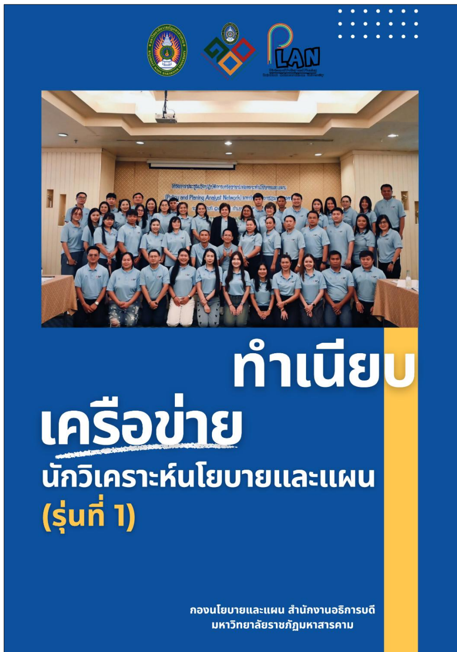
ภาพที่ 7 ทำเนียบ เครือข่ายนักวิเคราะห์นโยบายและแผน รุ่นที่ 1

กลุ่มงานวิเคราะห์นโยบายและแผน กองนโยบายและแผน สำนักงานอธิการบดี มหาวิทยาลัยราชภัฏมหาสารคาม ได้เผยแพร่ข้อมูล ทำเนียบ เครือข่ายนักวิเคราะห์นโยบายและแผน รุ่นที่ 1 https://plan.rmu.ac.th/th/?p=6642