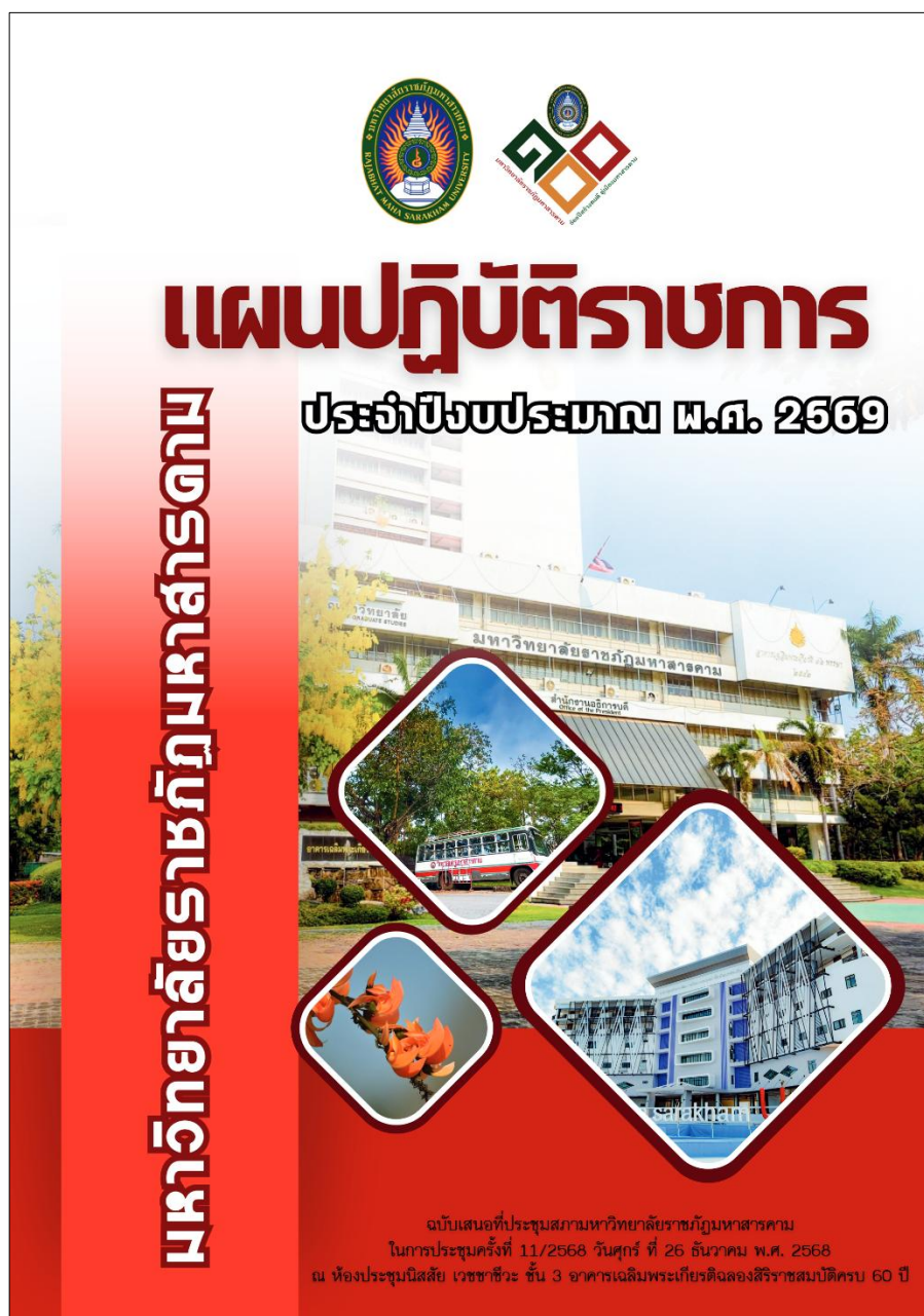
ภาพที่ 5 แผนปฏิบัติราชการ ประจำปีงบประมาณ พ.ศ.2569 มหาวิทยาลัยราชภัฏมหาสารคาม

กลุ่มงานวิเคราะห์นโยบายและแผน กองนโยบายและแผน สำนักงานอธิการบดี มหาวิทยาลัยราชภัฏมหาสารคาม ได้เผยแพร่ข้อมูล แผนปฏิบัติราชการ ประจำปีงบประมาณ พ.ศ.2569 มหาวิทยาลัยราชภัฏมหาสารคาม https://plan.rmu.ac.th/th/?p=6604