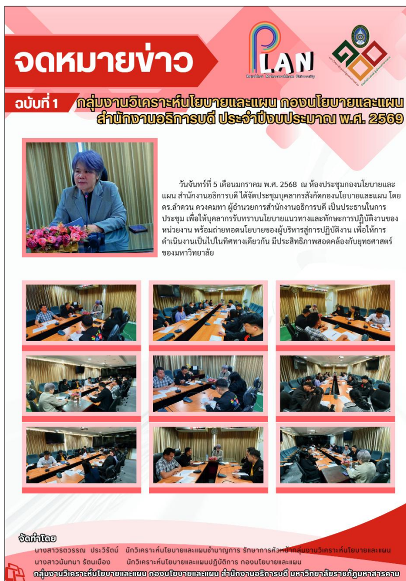
ภาพที่ 2 การประชุมบุคลากร สังกัดกองนโยบายและแผน สำนักงานอธิการบดี มหาวิทยาลัยราชภัฏมหาสารคาม

กลุ่มงานวิเคราะห์นโยบายและแผน กองนโยบายและแผน สำนักงานอธิการบดี มหาวิทยาลัยราชภัฏมหาสารคาม ได้เผยแพร่ข้อมูล การประชุมบุคลากร สังกัดกองนโยบายและแผน สำนักงานอธิการบดี มหาวิทยาลัยราชภัฏมหาสารคาม https://plan.rmu.ac.th/th/?p=6544