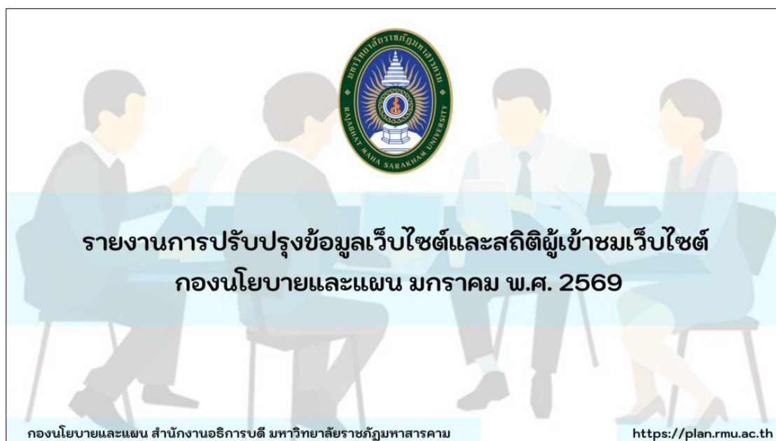
ภาพที่ 3 รายงานการปรับปรุงข้อมูลเว็บไซต์และสถิติผู้เข้าชมเว็บไซต์ กองนโยบายและแผน ประจำเดือน มกราคม พ.ศ.2569

กลุ่มงานสารสนเทศ กองนโยบายและแผน สำนักงานอธิการบดี มหาวิทยาลัยราชภัฏมหาสารคาม ได้เผยแพร่ข้อมูล รายงานการปรับปรุงข้อมูลเว็บไซต์และสถิติผู้เข้าชมเว็บไซต์ กองนโยบายและแผน ประจำเดือน มกราคม พ.ศ.2569 https://plan.rmu.ac.th/th/?p=6868