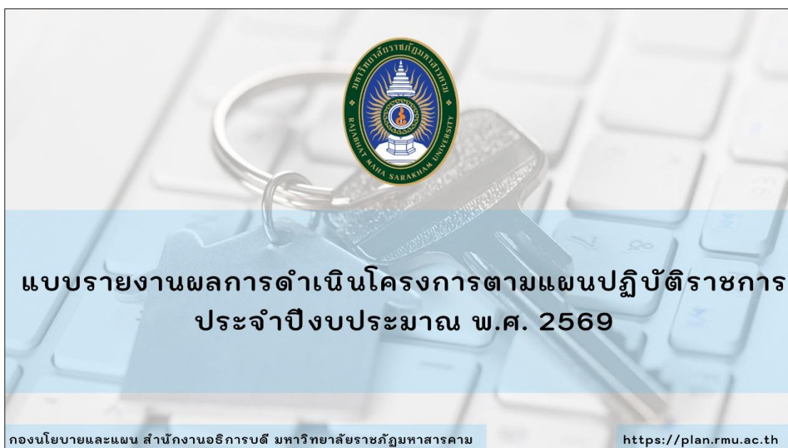
ภาพที่ 1 แบบรายงานผลการดำเนินโครงการตามแผนปฏิบัติการ ประจำปีงบประมาณ พ.ศ. 2569

กลุ่มงานวิเคราะห์นโยบายและแผน กองนโยบายและแผน สำนักงานอธิการบดี มหาวิทยาลัย ราชภัฏมหาสารคาม ได้เผยแพร่ข้อมูล แบบรายงานผลการดำเนินโครงการตามแผนปฏิบัติการ ประจำปีงบประมาณ พ.ศ. 2569 https://plan.rmu.ac.th/th/?p=6480